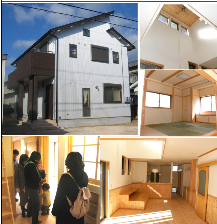
写真：現場見学会の様子

豊橋市内で積雪も観測された2月9日と10日の両日、お施主様のご好意により完成現場見学会を開催致しました。